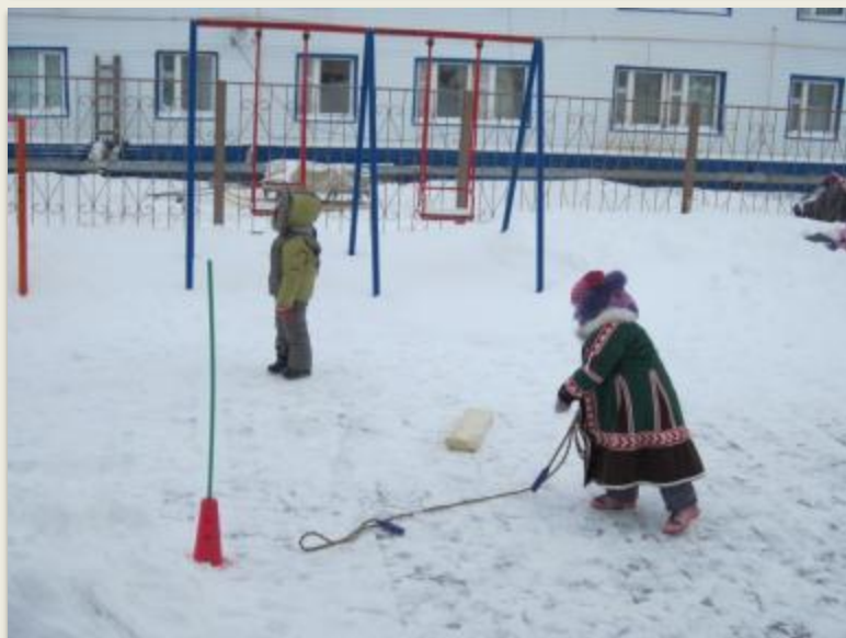
Метание тынзяна на хорей