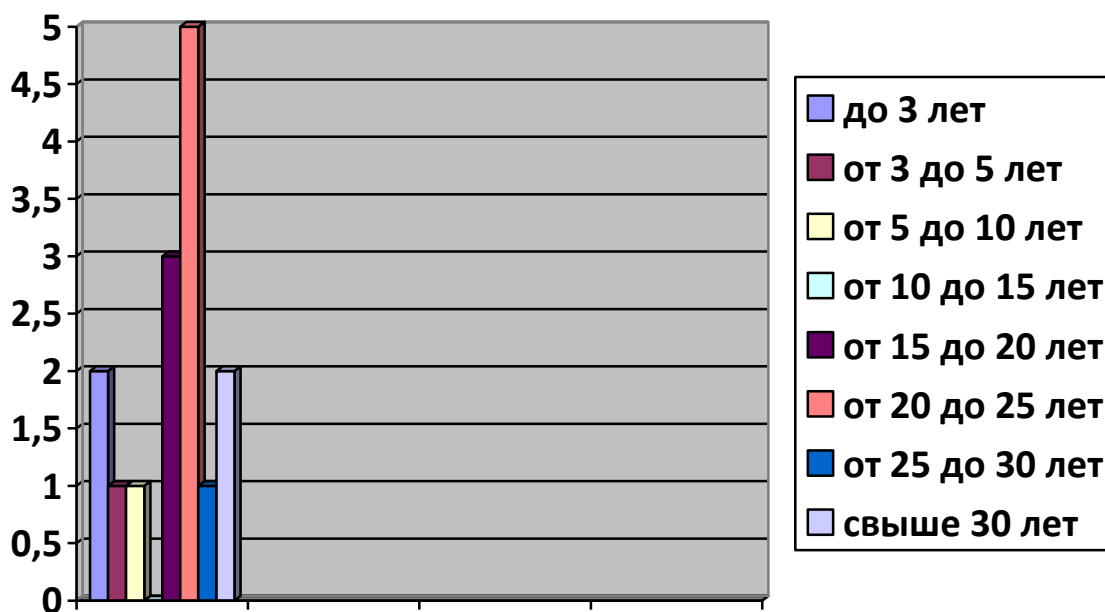
Стаж работы педагогов

Диаграмма с характеристиками кадрового состава МБДОУ детский сад «Солнышко»