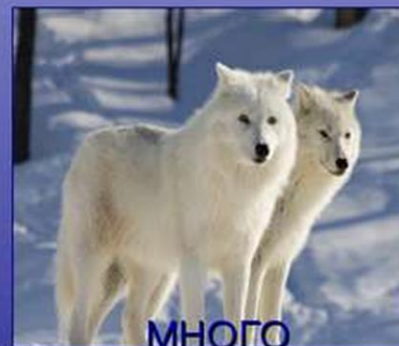
МНОГО БЕЛЫХ ВОЛКОВ