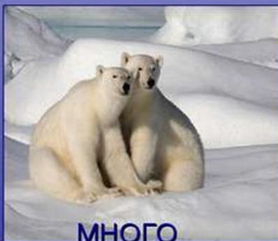
МНОГО БЕЛЫХ МЕДВЕДЕЙ