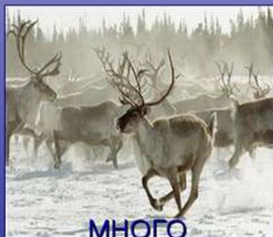
МНОГО СЕВЕРНЫХ ОЛЕНЕЙ