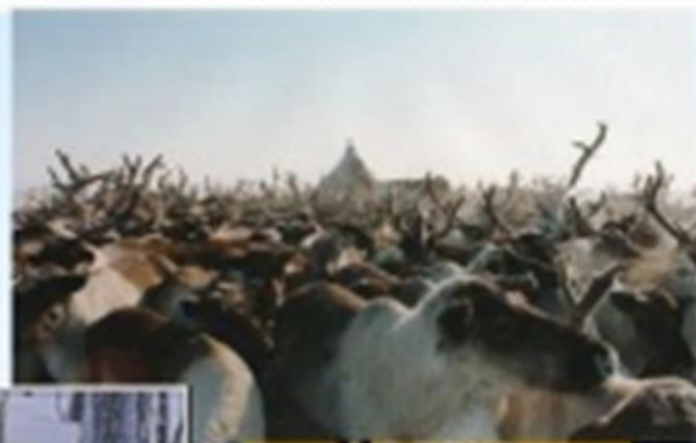
Молоко, масло, мясо

Олень - основа жизни многих народов севера.