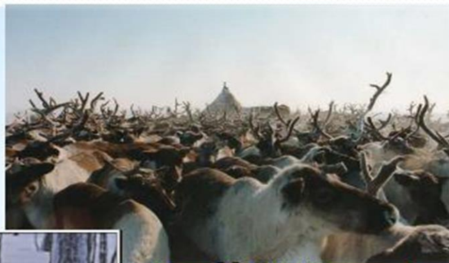
Молоко, масло, мясо

Олень - основа жизни МНОГИХ народов севера.